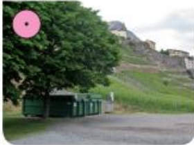
Place des Tilleuls (verre, papier, PET, textile, alu)