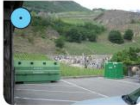
Place Ménier (verre, papier, PET)