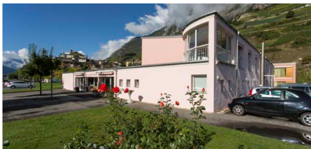
Au pied du Bourg et à proximité de l'école, le Foyer les Collombeyres.