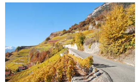
La vigne valaisanne est au cœur de la première édition de «Saillon, cité d'images».

photographes présents dans l'exposition. Une animation spéciale est destinée aux jeunes de 10 à 15 ans: un atelier photo en compagnie d'un professionnel de l'image.