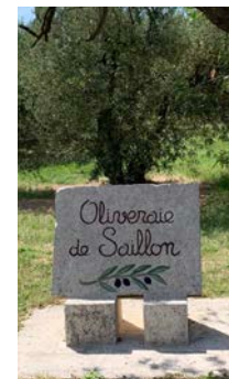
Un coin de Saillon au cœur de la Provence.

Un développement de synergies, notamment touristiques, ainsi qu'un renforcement de nos relations est désiré. A voir qui seront les interlocuteurs en 2020. Mars et octobre définiront les bases politiques de ce jumelage.