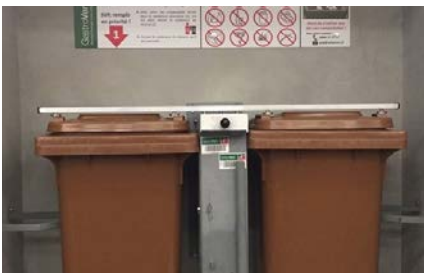
Huit installations GastroVert de ce type seront réparties sur le territoire communal.

Le sondage adressé en mars à tous les ménages de Saillon a connu un vif succès, avec 50% de formulaires retournés. Le nombre de personnes ayant répondu se monte à 1237; ce sont les ménages de une et deux personnes qui sont les plus représentés, avec plus du tiers des retours.