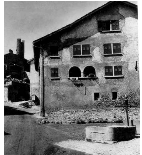
Fontaine de la place des Bourneaux. Photo de Max-F. Chiffelle tirée du livre Saillon d'André Donnet. Collection Trésor de mon pays. Editions du Griffon à Neuchâtel, 1950, p. 39.

Lorsque la guerre touche à sa fin, le président d'alors, Paul Gay, peut enfin relancer le projet. Dès lors, les événements s'enchaînent de manière positive. Durant toute l'année 1946, des prospections sont reprises avec d'éminents spécialistes. Elles aboutissent à la solution présentée à l'assemblée primaire du 9 février 1947, qui prévoyait au point 1 de son ordre du jour: «Projet de création d'une station de pompage en Lydésoz, avec