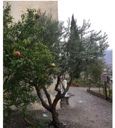
Le sol du jardin est appauvri, les arbustes ne grandissent plus et la chaleur torride, en été, décourage le public.

Le projet est actuellement entre les mains de deux spécialistes. Les travaux de rénovation démarreront au printemps prochain et s'étaleront sur plusieurs mois, afin que le jardin transformé soit accessible pour l'automne 2019, à l'occasion des Fêtes Médiévales.