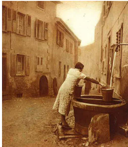
Fontaine du Bourg.

Devant les constantes augmentations en besoins, la recherche d'eau se poursuit. Le