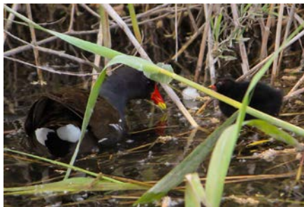
Gallinule poule d'eau avec son jeune.

et le Râle d'eau ( Rallus aquaticus ). La première, reconnaissable à son court bec jaune et rouge, niche dans les roseaux et passe l'hiver le long du canal. De plus petite taille, le second possède un long bec rouge et ne passe que l'hiver chez nous, souvent caché dans les roseaux. Ces deux espèces sont relativement rares en Valais, en raison des trop rares biotopes de roseaux nécessaires à leur présence.