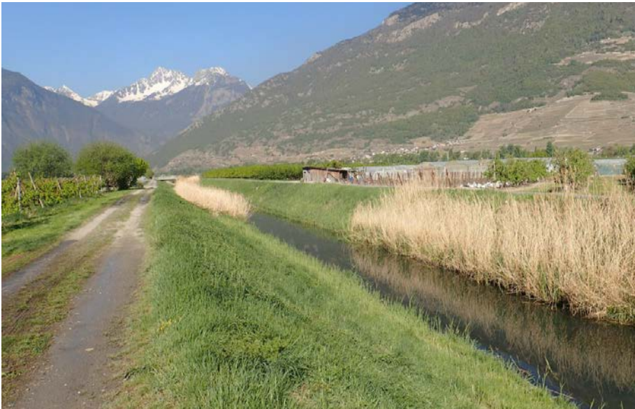
Le canal du Syndicat à Saxon, exemple d'un entretien différencié, avec fauche alternée.

La biodiversité est la grande gagnante de la nouvelle façon d'entretenir les canaux. Les réglementations cantonales et fédérales en vigueur laissent davantage de place à la nature et à la faune.