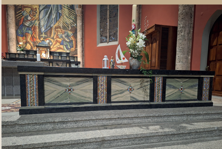
Autel de l'église de Chamoson