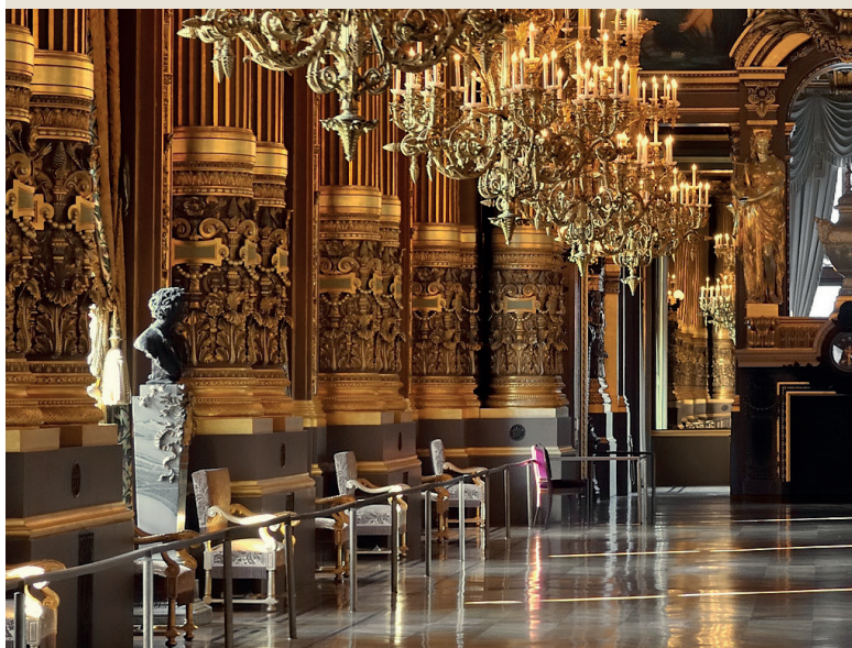
Opéra Garnier, Paris

L'architecte Charles Garnier de l'Opéra de Paris, a choisi ce marbre pour ses œuvres, louant les qualités de cette splendide matière. Son engouement a valu au marbre de Saillon la réputation d'être le plus beau, mais aussi le plus cher du monde.