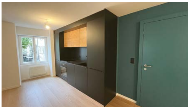
Grâce à sa rénovation (photo avant, et après), l'appartement a retrouvé un locataire.