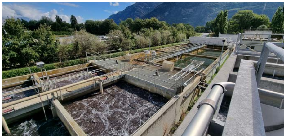
La STEP actuelle de Saillon est aux normes. Des investissements seront régulièrement consentis pour la maintenir performante.

Un projet régional pourrait cependant tout de même voir le jour, les trois autres municipalités poursuivant les discussions dans ce sens.