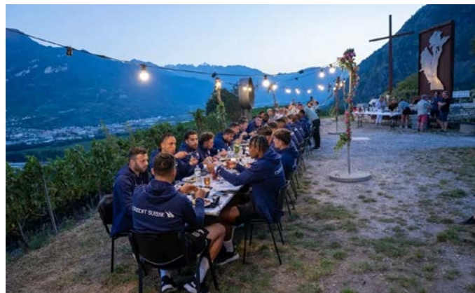
Une «tavolata» a été dressée sur la colline pour la Nati début septembre. Les joueurs et leur entraîneur y ont partagé un repas diététique, avec vue sur la plaine du Rhône et coucher de soleil.