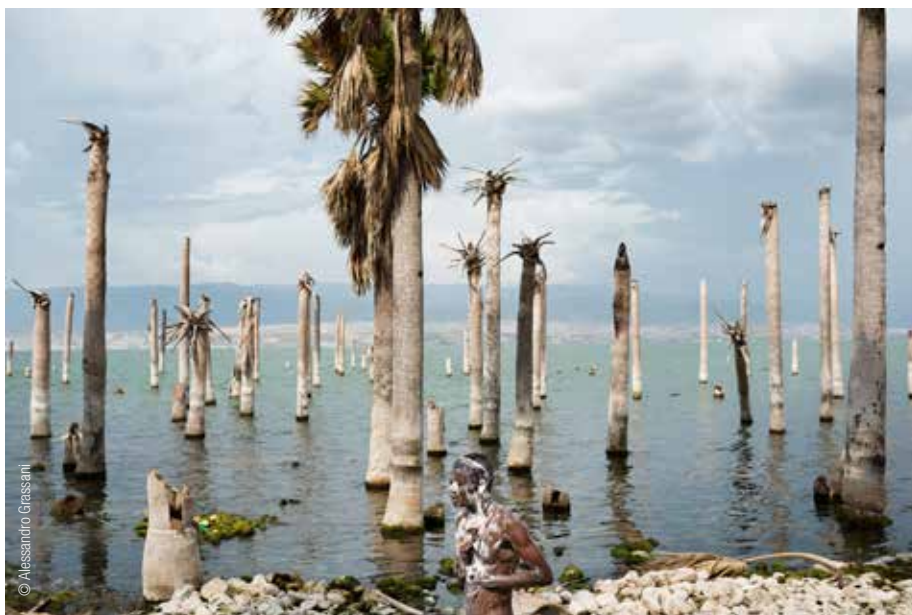
Haiti. Un garçon se lave sur la rive du lac Azuéi. Ce lac n'a jamais été si grand: il a doublé de volume au cours des 10 dernières années. Les scientifiques pensent que le réchauffement climatique est responsable de cette évolution et des troncs de palmiers morts...