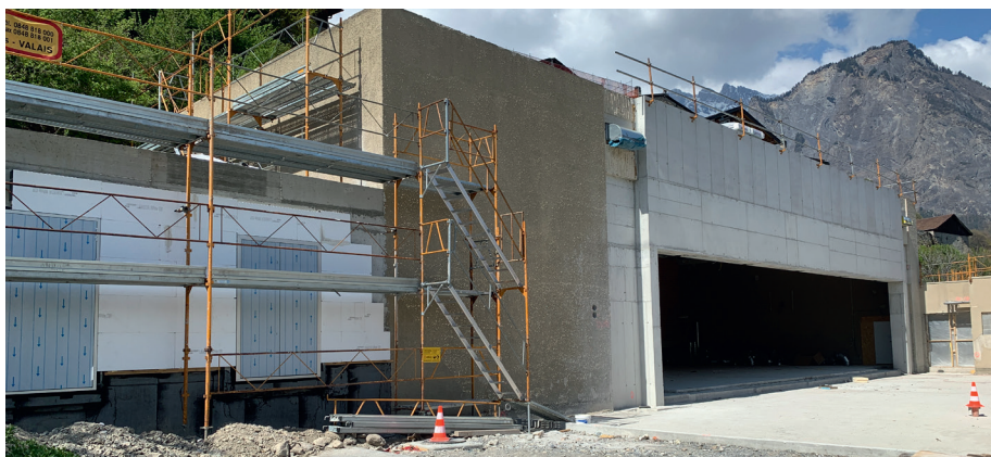
De gauche à droite, le nouveau local d'arrière-scène, la salle de gym mise à nu et la dalle de la future salle de L'Envol.