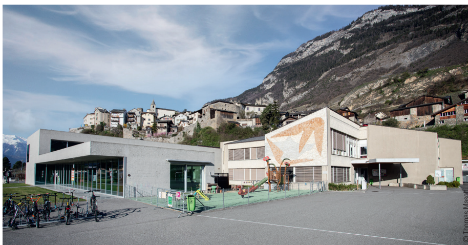
La mutualisation de l'eau de la nappe phréatique permettra de chauffer les bâtiments du secteur des Collombeyres.

Une gestion intelligente de l'eau de la nappe phréatique permettra aux différents bâtiments du secteur des Collombeyres de se passer complètement d'énergie fossile. Une solution sur mesure qui devrait être réalisée d'ici l'hiver 2022.