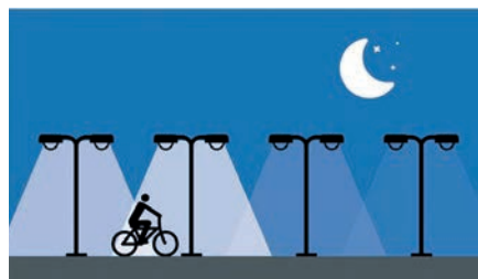
Le système en place détecte la présence de personnes et augmente l'intensité lumineuse à leur passage.

usager augmente son intensité lumineuse et transmet l'information aux deux luminaires précédents et aux deux suivants, qui augmentent également leur intensité. Et ainsi de suite, au fur et à mesure que l'usager progresse dans la rue. L'abaissement reprend après environ 2 minutes si aucun autre usager n'est détecté.