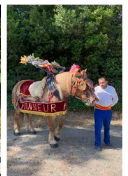
Reçus avec les honneurs, par un sympathique ambassadeur.