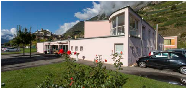
Au pied du Bourg et à proximité de l'école, le Foyer les Collombeyres.