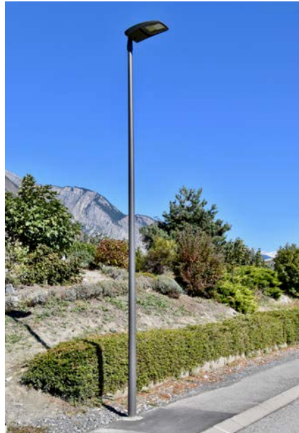
Les luminaires Teceo du chemin des Promenades, un élégant concentré de technologies.

Dès qu'un usager (piéton, cycliste ou voiture) est détecté par les capteurs intégrés, l'intensité monte à 80% durant au moins 2 minutes. Les luminaires sont programmés sous forme de matrice, cela signifie que le candélabre qui détecte un