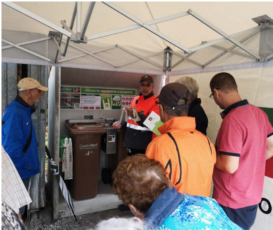
Le système de collecte des déchets alimentaires GastroVert trouve sa place dans les ménages.

A l'instar d'autres municipalités utilisant GastroVert, nous allons demander à l'Antenne Région Valais, notre gestionnaire pour la rétrocession de la taxe sur les sacs, que le tonnage des bacs GastroVert soit comptabilisé avec le tonnage des sacs blancs, afin de percevoir une rémunération sur le tout.