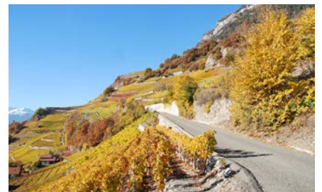
La vigne valaisanne est au cœur de la première édition de «Saillon, cité d'images».

photographes présents dans l'exposition. Une animation spéciale est destinée aux jeunes de 10 à 15 ans: un atelier photo en compagnie d'un professionnel de l'image.