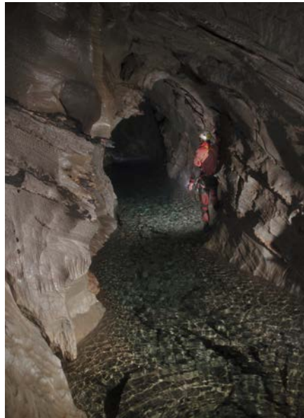
Les eaux de la Sarvaz transitent par la rivière souterraine du Poteu, photographiée ici en décembre 2010.

De plus, ces eaux souterraines parcourent plus de 7,5 kilomètres à vol d'oiseau, et ce en moins de 24 heures. Ces temps de transit, très rapides pour des eaux souterraines, peuvent s'expliquer uniquement par le fait que les eaux empruntent des réseaux de cavités naturelles, «comme dans un tuyau».