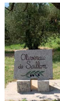
Un coin de Saillon au cœur de la Provence.

Un développement de synergies, notamment touristiques, ainsi qu'un renforcement de nos relations est désiré. A voir qui seront les interlocuteurs en 2020. Mars et octobre définiront les bases politiques de ce jumelage.