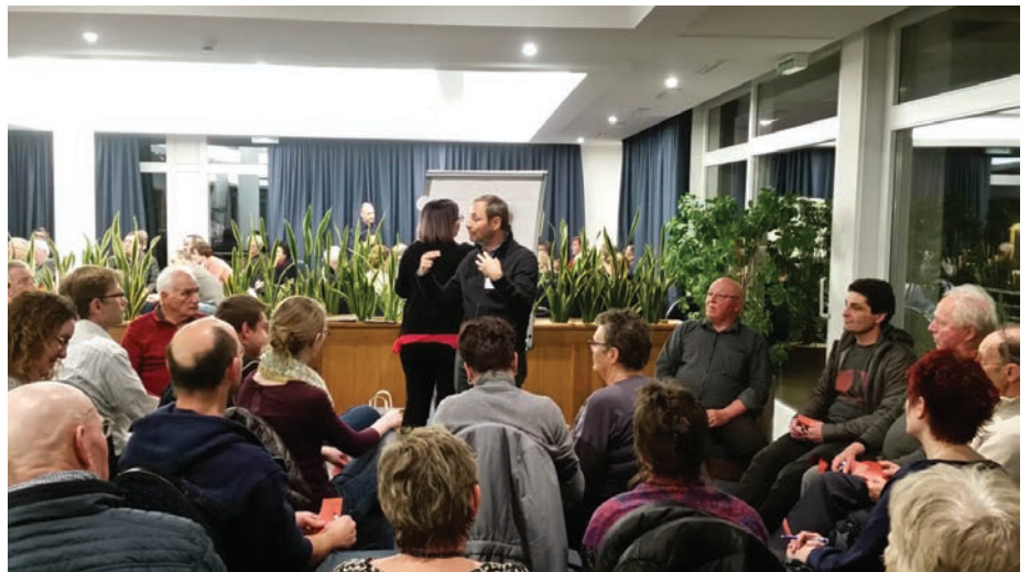
La soirée consultative du printemps avait donné lieu à des ateliers riches en échanges.

des résultats, un nouveau volet s'ouvrira en 2020, consacré à l'examen des compatibilités entre les cinq communes. Le collectif Fuzio, qui nous accompagne dans cette démarche, procédera à une analyse détaillée et produira cinq pré-rapports, qui vous seront dévoilés au printemps prochain.