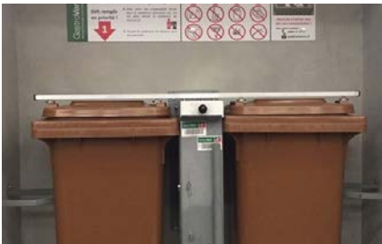
Huit installations GastroVert de ce type seront réparties sur le territoire communal.

Le sondage adressé en mars à tous les ménages de Saillon a connu un vif succès, avec 50% de formulaires retournés. Le nombre de personnes ayant répondu se monte à 1237; ce sont les ménages de une et deux personnes qui sont les plus représentés, avec plus du tiers des retours.