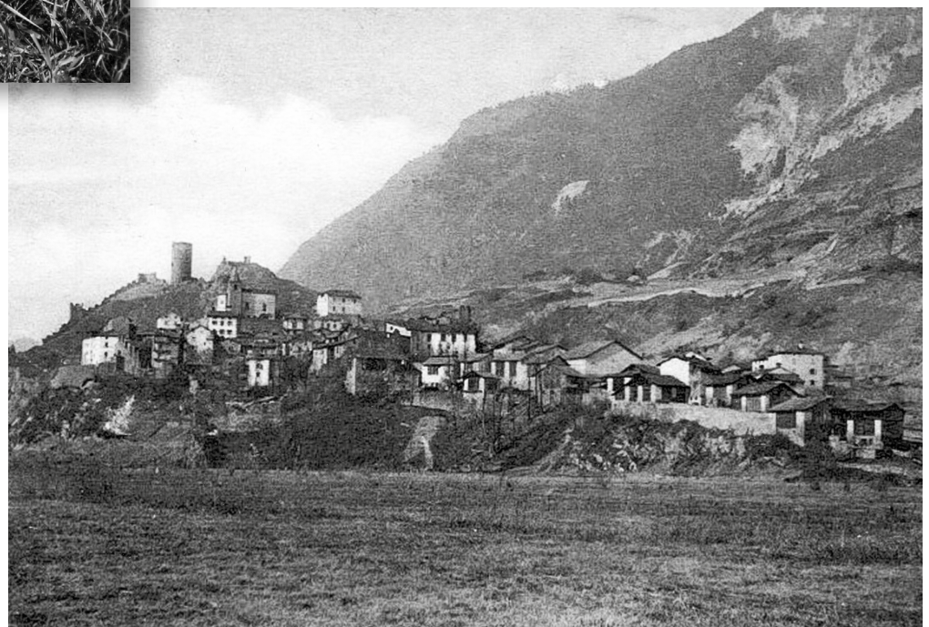
N° 816 - Depuis la route du Marais Neuf vers 1900 - Patrimoine de Saillon - Fonds Henri Thurre