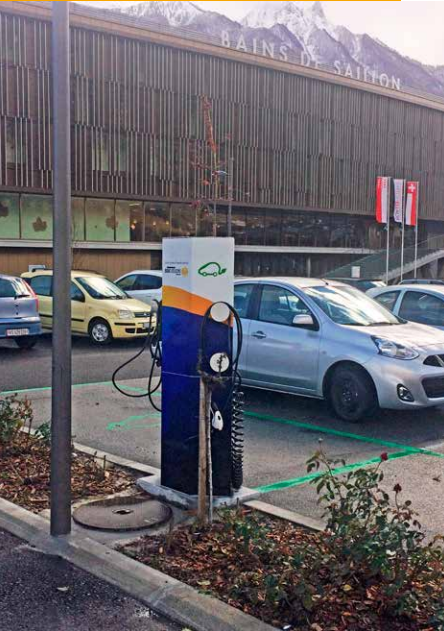
Borne des Bains de Saillon