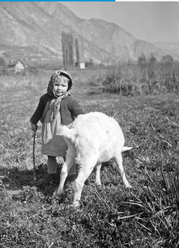
N° 1863 - Vers la chapelle vers 1930