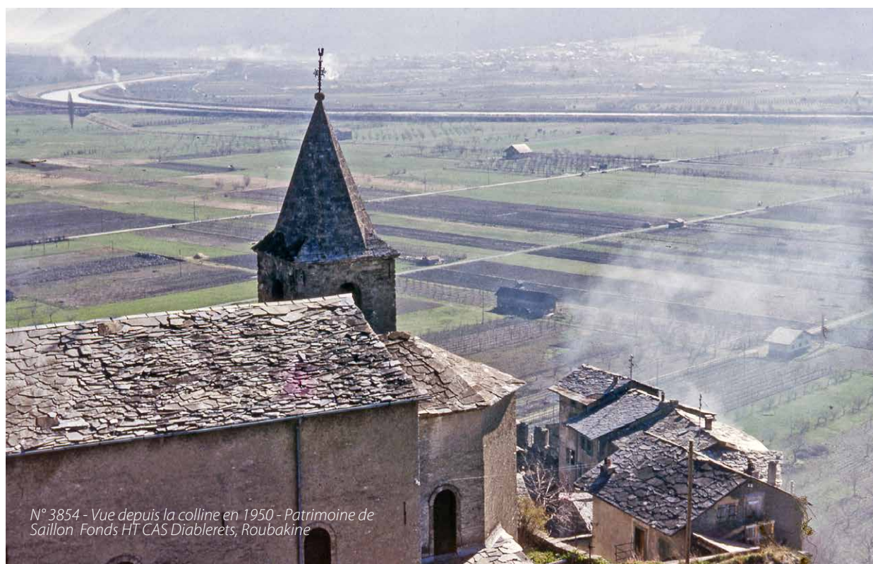
N° 3854 - Vue depuis la colline en 1950