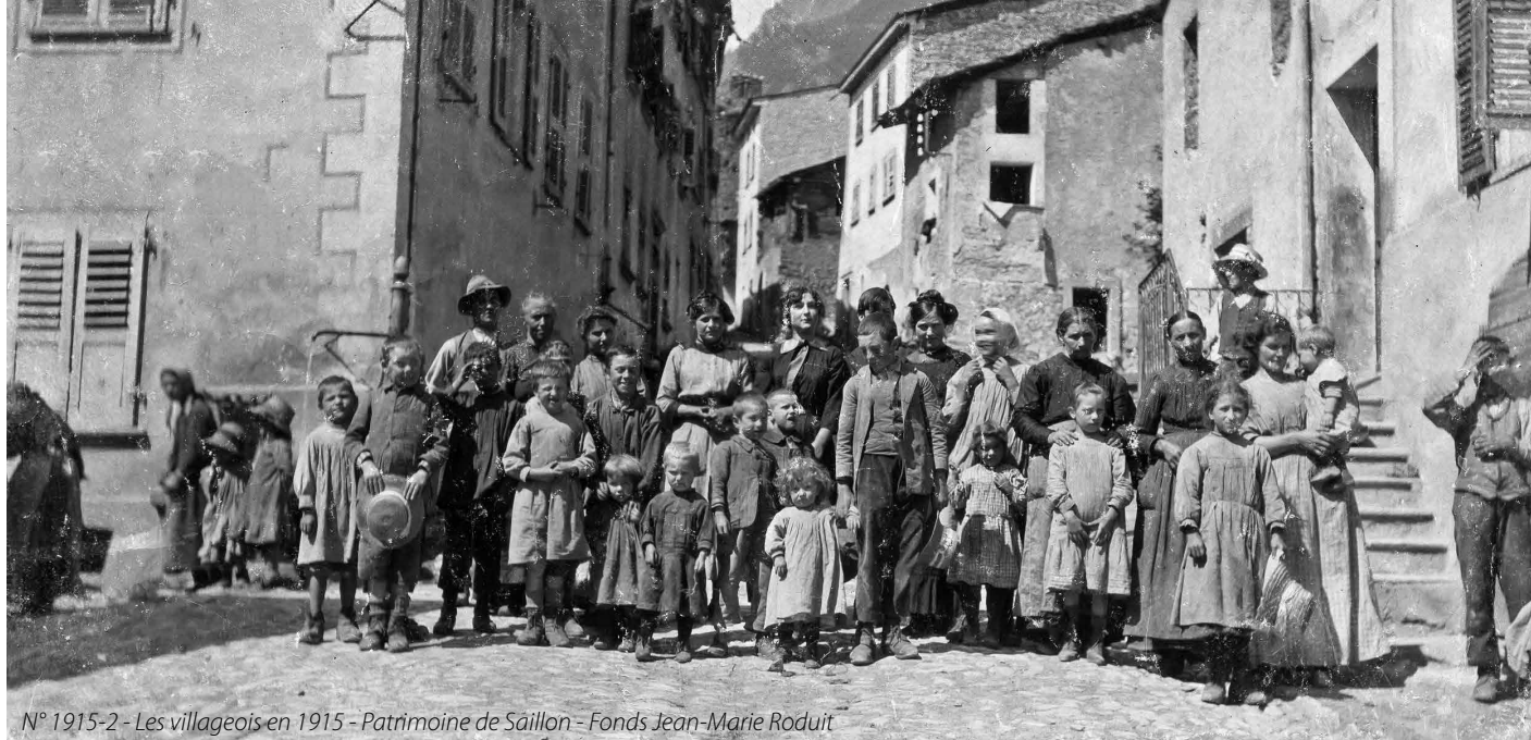
N° 1915-2 - Les villageois en 1915 - Patrimoine de Saillon