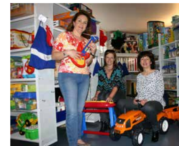
Un trio gagnant heureux