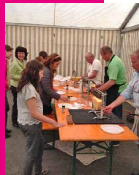
Les racleurs à l'oeuvre