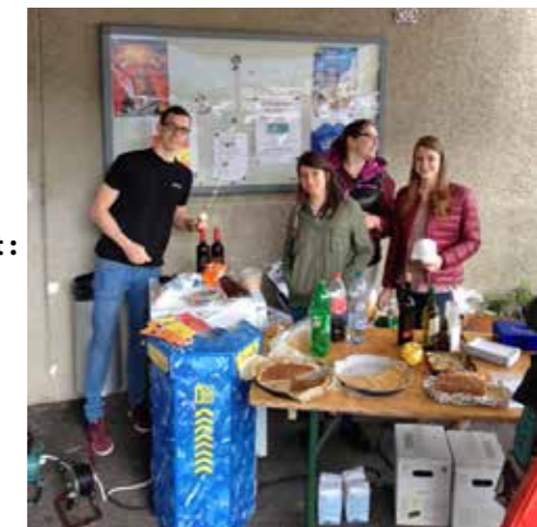
La jeunesse a joué le jeu

Organisée par les commissions sociales des communes de Saillon et de Leytron www.saillon.ch – www.leytron.ch