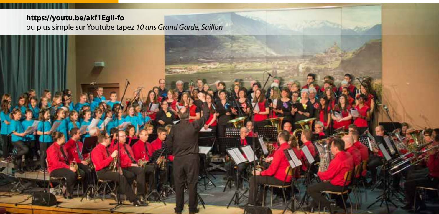
Concert de la fanfare La Grand Garde, du chœur d'enfants et du chœur mixte qui s'est déroulé le vendredi 22 avril 2016 à télécharger sur youtube

https://youtu.be/akf1Egll-fo ou plus simple sur Youtube tapez 10 ans Grand Garde, Saillon