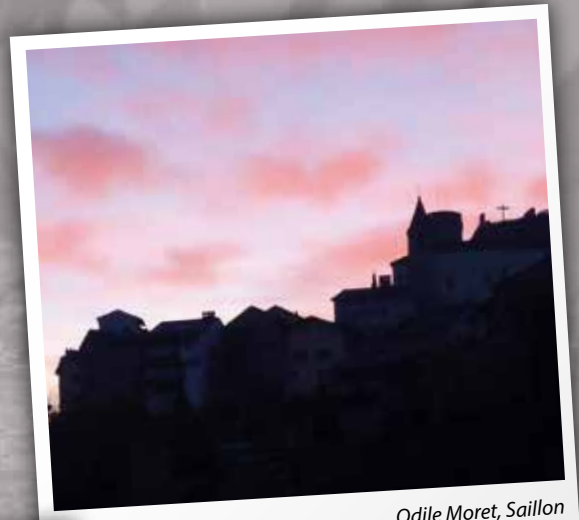
Odile Moret, Saillon