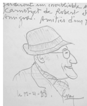
Photographie de la caricature de Robert Cheseaux