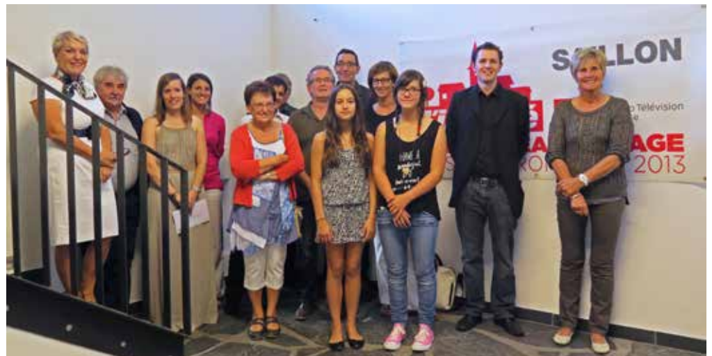
Jurés et gagnants réunis pour la photo souvenir le 22 août, lors de la remise des prix.