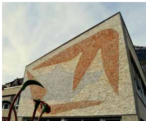
Photographie de la mosaïque de JCM