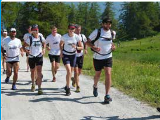
En plein effort, mais on se rapproche