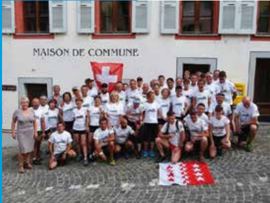
Les coureurs en pose devant la maison de commune aux côtés de la présidente et du vice-président