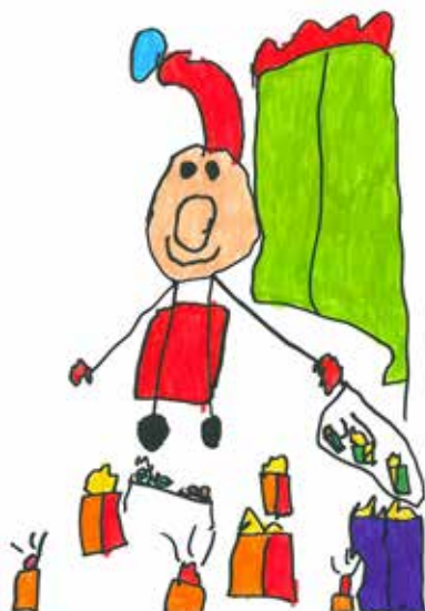
Des élèves des enfantines de Saillon illustrent le TH