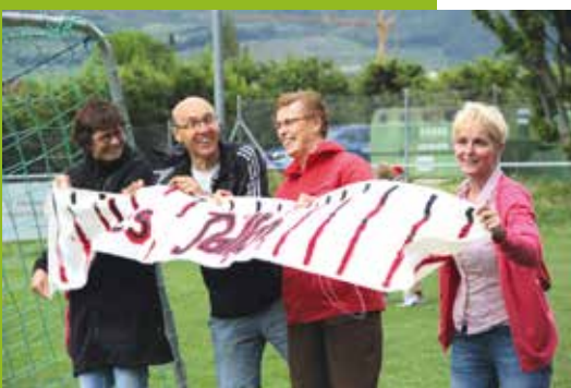
La clôture 2012 sous le signe du fair play et de la bonne humeur