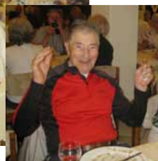
▲ Sortie des aînés