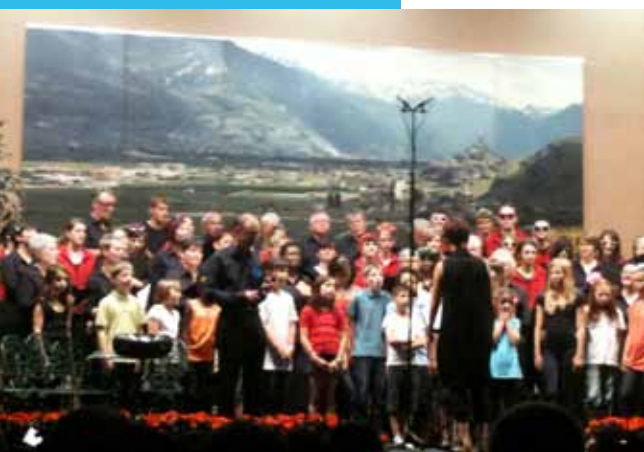
Trois générations en concert.

La liste complète des sociétés locales de Saillon avec les personnes à contacter se trouve sur le site : www.saillon.ch