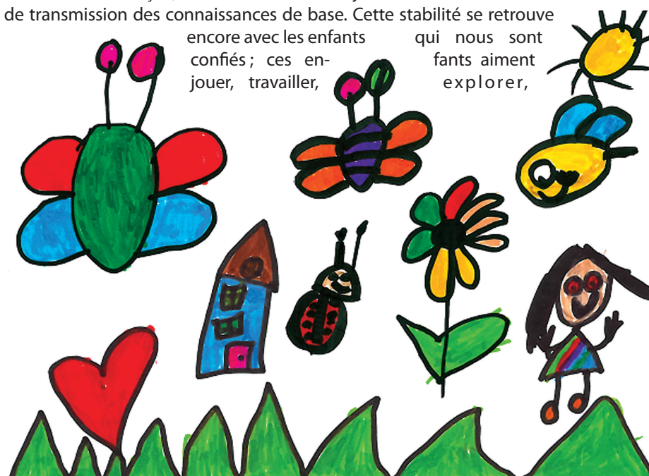
Les dessins réalisés par les écoles enfantines agrémentent notre Tour d'horizon.

encore avec les enfants qui nous sont confiés ; ces enfants aiment jouer, travailler, explorer,